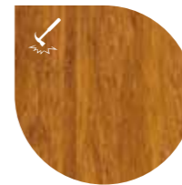
Density® Caramel gelakt (extra mat) (BF-DT459) / geolied (BF-DT453)